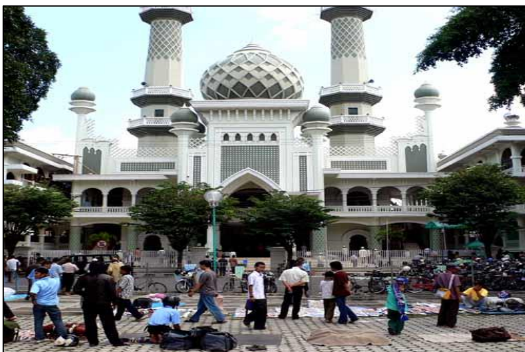
Gambar 5 Masjid Jami' Malang

Aspek Sosial-Budaya. Dari sisi budaya, Malang memiliki tiga sub-kultur, yaitu sub-kultur budaya Jawa Tengahan yang hidup di lereng gunung Kawi, sub-kultur Madura di lereng gunung Arjuna, dan sub-kultur Tengger sisa budaya Majapahit di lereng gunung Bromo-Semeru. Budaya asli Malang ini kemudian bergabung menjadi satu dengan berbagai budaya dan tradisi yang dibawa oleh masyarakat pendatang. Sebagaimana kondisi kota-kota besar di Indonesia, Malang kemudian berkembang sebagai kota pertemuan berbagai budaya, tradisi dan adat istiadat.