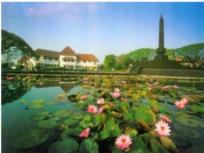
Gambar 3 Balai Kota Malang dengan Tugu di depannya.

indah. Gambaran Balai Kota Malang meniru kota-kota di Eropa, khususnya Belanda dengan taman dan air mancur di depannya.