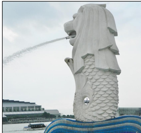
Gambar 1 Patung Singapoera di perumahan mewah Surabaya (atas) sebagai simbol globalisasi. Singapura sebagai acuannya (foto aslinya di bawah)