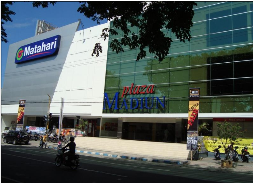
Gambar 7 Salah satu Plaza di Kota Madiun. Megah, meninggalkan tradisionalisme Jawa

negeri, melainkan juga untuk tujuan ekspor ke Malaysia dan Thailand. Kapasitas produksi per tahun menghasilkan di antaranya 300 gerbong barang, 60 kereta penumpang, 40 KRD dan KRL.