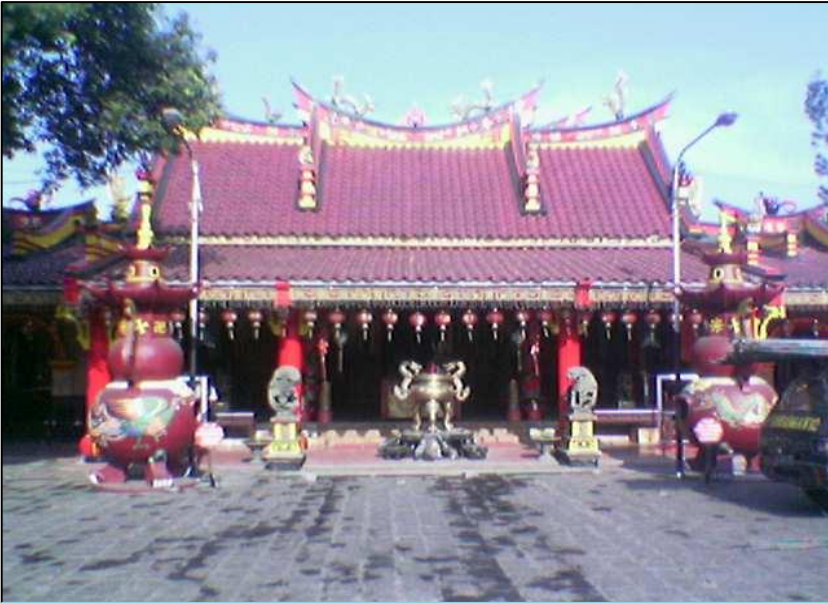
Gambar 6 Klenteng Eng An Kiong dekat Alun-alun Malang

Dari segi etnisitas, suku Jawa adalah mayoritas di Kota Malang. Sedangkan kelompok minoritas yang memiliki peranan penting adalah Madura dan Tionghoa. Etnis Tionghoa menguasai perekonomian, khususnya perdagangan dan jasa dalam skala besar, sedangkan etnis Madura di level perdagangan kecil dan sektor informal. Bahasa yang dipakai dalam komunikasi sehari-hari adalah bahasa Jawa dengan dialek Jawa Timuran, dengan ciri bahasa walikan khas Malang. Artinya bahasa yang diucapkan secara terbalik. Seperti contoh berikut: arek malang dituturkan dengan kera ngalam, singo edan menjadi ongis nade dsb. Kata-kata di atas sering juga masuk dalam bahasa surat kabar. Hal itu dianggap sebagai salah satu identitas kota Malang. Bahasa Jawa Timuran juga muncul di JTV. Di Malang Raya banyak tv lokal seperti Gama TV (Budha), Malang TV, Batu TV, ATV, dan