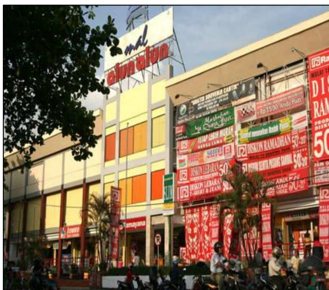
Gambar 4 Mall Alun-alun Kota Malang.

kosmologi Jawa yang setengah hati. Kantor Kabupaten terletak di bagian Timur dan Masjid Jamiik di bagian Barat, tetapi Gereja GPIB Jemaat Imanuel tepat bersanding dengan masjid tersebut. Sementara itu, Gereja Katholik Hati Kudus Yesus di Jalan Basuki Rahmat dekat Sarinah. Gereja itu tidak jauh dari Masjid Jamiik dan Kantor Kabupaten. Lebih dari itu, corak perdagangan tidak jauh tempat tersebut. Kampung Pecinan dengan Klentengnya.